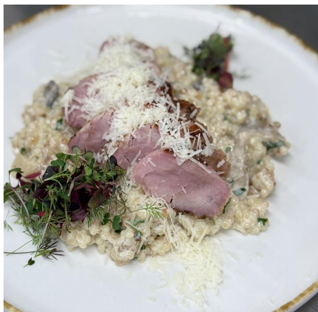
SEZÓNNE HLAVNÉ JEDLO

0,33l Šošovicový krém /6,49€ s klobáskou od Gašparíka a kváskovým chlebíkom (1,7,9)